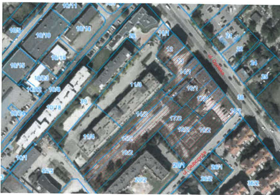
Lokalizacja terenu inwestycji

Na terenie placu budowy przed wyjazdem zostanie urządzone stanowisko do czyszczenia kół pojazdów, zaopatrzone w myjkę ciśnieniową. Wykonawca robót będzie zobowiązany do usuwania wszelkich zanieczyszczeń spowodowanych przez pojazdy budowy w pasie drogowym ul. Głubczyckiej. Szczegółowy plan obsługi komunikacyjnej placu budowy zamieszczono na zagospodarowaniu terenu rys. nr 2.